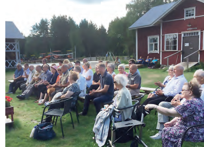
11.8.2018 kokoonnuttiin sukuseuran kokoukseen Ahvenisen Punaisella talolla.

tisjuhlakokoukseen osallistui 45 henkilöä. 11.8.2018 Ahvenisen Punaisella talolla pidetyssä kokouksessa oli paikalla 47 suvun jäsentä.