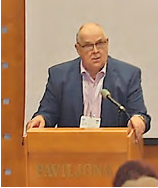
Juhlapuhe Hyvät sukulaiset, Laukkasten sukuseuran jäsenet, hyvä juhlayleisö!

Monille merkitsee paljon, että voi isolla joukolla kokoontua yhteen sellaisten ihmisten kanssa, joiden tietää polveutuvan samasta juuresta kuin itsekin. Sukujuhlassa tämä yhteenkuuluvuus vaan tiivistyy. Tämän olen saanut kokea muutaman kerran.