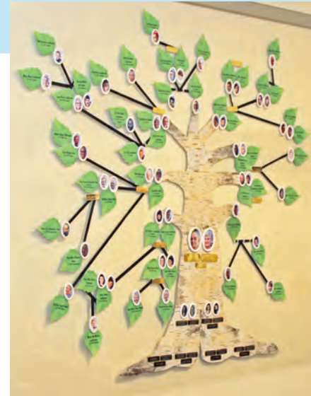
Sukuuu Oton olohuoneen seinällä Punkaharjun kodissa.

Tekemällä oppii ja oivaltaa. Montaa kohtaa voisi tehdä visuaalisesti vielä kauniimmin. Nyt on korjauksen alla kotona oleva sukuu, ja Oton sukuuuta olen päivittänyt uusien iloisten perheutisten myötä Salla Rossi