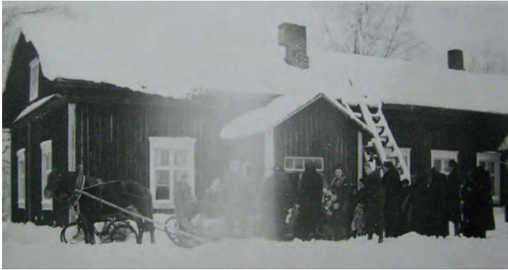
Kintaan talo. Väki lähdössä hautajaisiin.