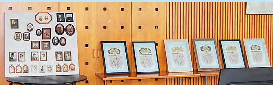
Suku puut ja taulut.

Minä rikas olen, rahaa ei mulla, mutta ystävät on, tuo rikkaus niin suuri jotka sanovat mulle tuu joukkohon meidä.