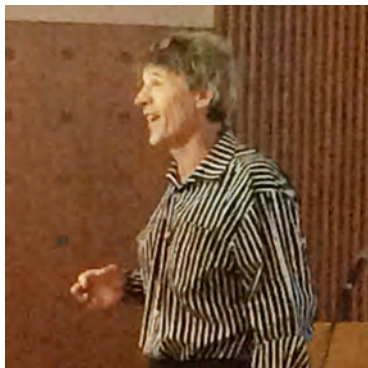
Kuulimme myös pohjanmaalaisen ruotsinsuomalaisen käsityksiä savolaisuudesta.