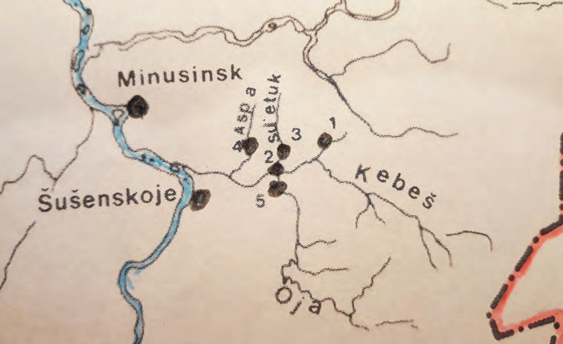
Jeniseijoki on merkitty sinisellä ja Kiinan raja punaisella. Siirtokunnat numeroituina: 1. Vernaja Bulanka (virolaisten alue), 2. Niznaja Bulanka (latvialaisten alue), 3. Verhne Sujetuk (suomalisten alue), 4. Dubenskoje. 5. Jermakovskoje. Karttaa käytetty Alpo Jantusen luvalla.

kodista saadut elämän eväät eivät tainneet olla kovinkaan kummoiset.