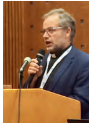
Juhlissa oli myös hartaushetki.