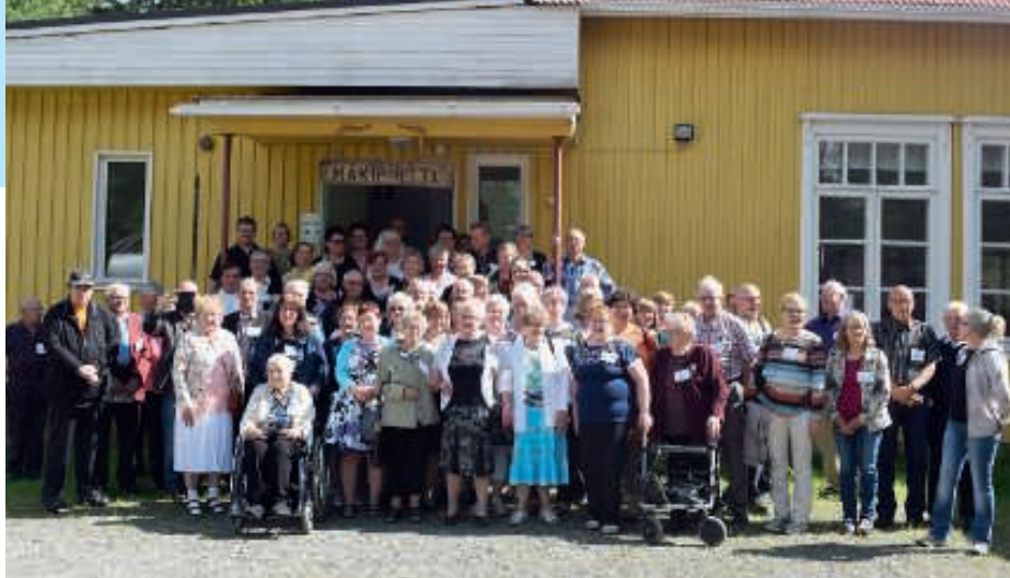
Kinttaan Laukkaset ryhmäkuvassa 2019 Pirttimäen koululla.