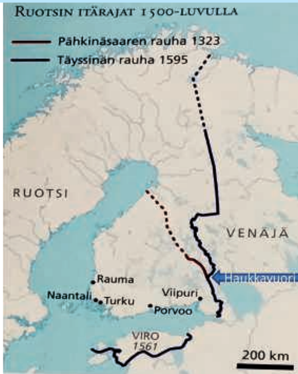
Ruotsin itäraajat 1500-luvulla.