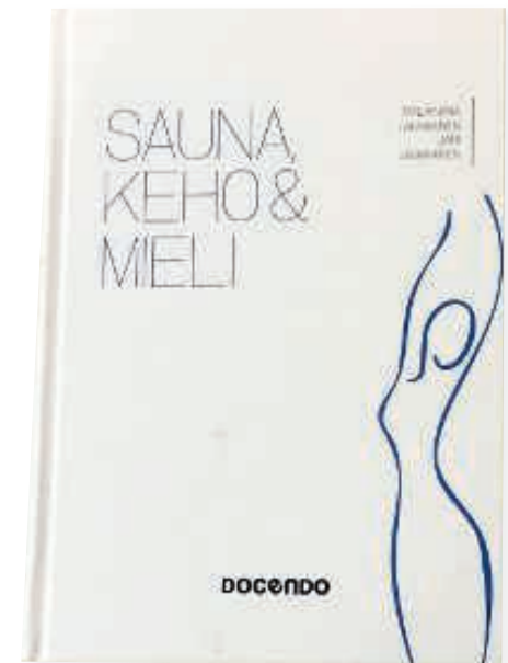
Sauna, keho & mieli

Tutkijoiden mukaan suomalainen sauna on tutkitusti ja kokemuksellisesti varsinainen terveyskylpylä. Sauna antaa hyvää oloa ja hyvinvointia, kantaa muistoja ja kulttuurisia merkityksiä. Laukkasten mukaan sauna kuuluu