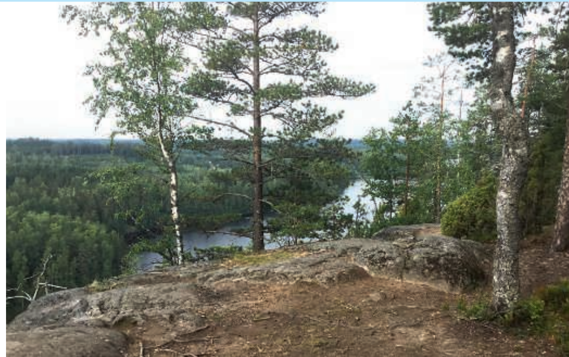
Näkymän Haukkavuoren huipulta Sarajävelelle.

Nevan niskalla Pähkinäsaarella solmittiin v. 1323 rauha, jonka rajalinjasta on pohjoispään osalta monta tulkintaa. Eteläpäästä raja alkoi Siestarjoen luota Rajajoesta ja se halkaisi Karjalan kannaksen lähes keskeltä itä- ja länsiosaan. Tutkijat ovat yhtä mieltä siitä, että rajalinja kulki Torsanjärveltä tänne Haukkavuorelle ja siitä edelleen Pihlajaveden Särkilahteen. Venäjä luovutti Ruotsille Äyräpään (länsi-Kan-