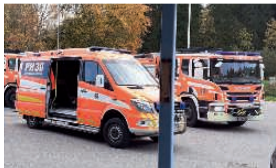
Palokunta saapui paikalle neljällä ajoneuvolla.