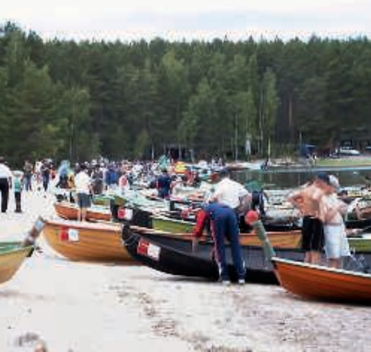
Puruveden Lohikuninkuus–kilpailu alkamassa.

pahtumia peruttiin. Onneksi kuitenkin kesäksi saimme ravintolan avattua. Kiitokset asiakkaillemme että olette tulleet lomaillemaan terveinä. Samoin henkilökuntamme on saanut palvella kesän terveenä.