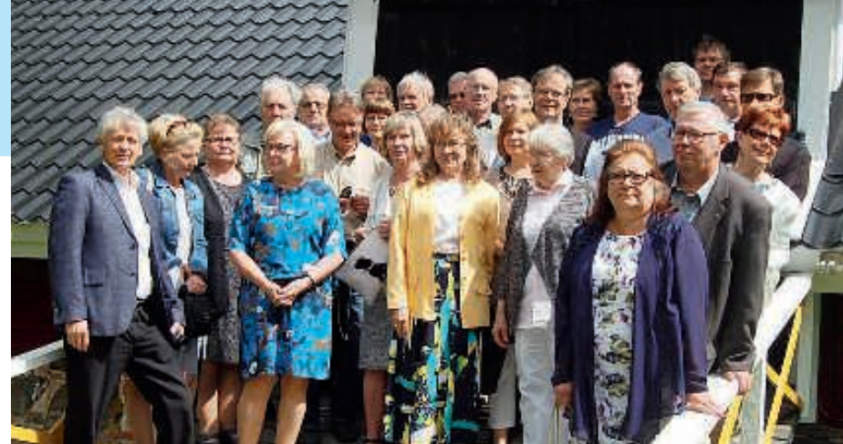
Kinttaan Laukkasten serkkutapaaminen Lopella 2017 Willa Ellenissä.

Muuten kuinka moni aktiivinen seniorijäsen on kertonut lapsenlapsilleen, mihin sukuhaaraan kuuluu ja kuka on ns. lähtöhenkilö? Tuskin monikaan. Eivät ne potentiaaliset jäsenehdokkaat tyhjästä tipahda, vaan jokaisen meistä, jotka olemme jäseniä, oltiinpa sitten aktiivisia tai passiivisia, seniori- tai juniorijäseniä, on velvollisuus kertoa jälkipolvilleen sukunsa vaiheista ja siinä samalla Laukkasten Sukuseura ry:stä.