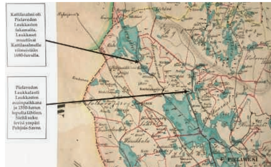
Ensimmäisten Pielaveden Laukkasten asuma-alueen kartta (sukukirjan sivu 231). Outo luikertava reitti yläoikealla on vedenjakaja, Suomenselän korkein kohta tällä alueella. Sulkavanjärvi laskee Runnille ja sieltä Iisalmen-Kuopion suuntaan, Saimaan vesistöön. Kartta on tehty vv. 1852-56. Jo silloin ovat vedenjakajan vaasisijat osanneet asiansa!

Alkeellista, työvaltaista touhua, ainakin tehokkaan nykymaailman mittareilla tarkasteltuna. Täytyy kuitenkin muistaa, että puuttuvien tiieverkoston ja kuljetuskaluston takia uittokuljetus oli ainoa tapa siirtää latvavesiltä näinkin