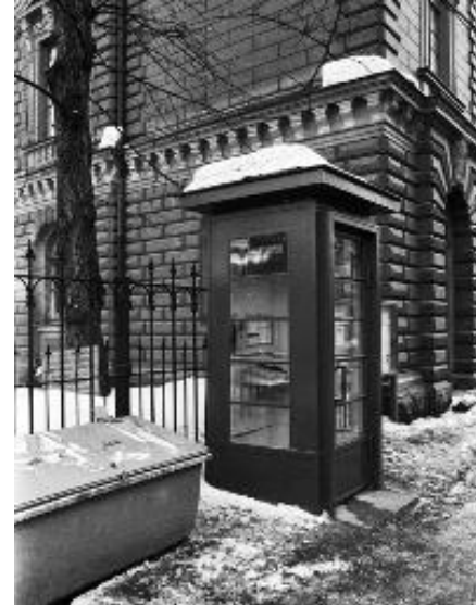
Helsinki, Mariankatu 23, Kuvaaja Rista Eeva, SER, Valokuvaaja, Helsingin kaupungin museo. CC BY 4 merkintä.

Laukkasten varsinainen sukukokous on 3.7.2021 Hotelli Tallukassa Asikkalan Vääksyssä. Tapahtuma käsittää kokouksen ja juhlaosion. Tapahtuman ohjelma ja ilmoittautuminen julkaistaan seuraavassa lehdessä ja Laukkasten Sukuseura ry:n kotisivuilla sekä