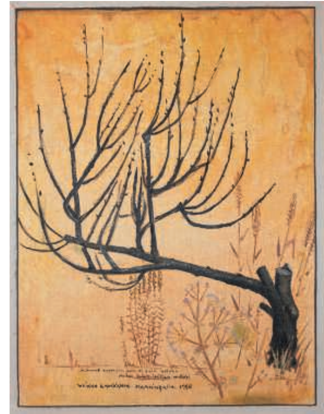
”Kuiyunut omenapuu, joka ei kelpaa enää muuhun kuin taitelijan malliksi.”

Veikko Laukkasen oma teksti korostaa kuvan surumietteisyyttä (omenapuu, joka ei kelpaa enää muuhun kuin taitelijan malliksi). Omenapuu on tiensä päässä. Näkymää korostavat tuleentuneet viljantähkät. Näin ollen kuva toimii myös runollisena mietelmänä kaiken katoavaisuudesta. Kuvan edessä me joudumme pohtimaan, miten hyväksyä kuolema, tarpeettomuus, loiston katoavuus ja muutos.