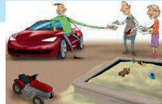
Uutukainen ajokortti poltteele taskussa. Nuorimies kenties lähdössä sukukokoukseen 18-vuotiaan innolla...?

Vastaavasti kysyntäpuolella on mietittävä, mitä jäsenet odottavat saavansa seuralta. On saatu jo sukuselvitys, lehti kahdesti vuodessa, sukukirja monen muun myyntituotteen ohella, Facebook-ryhmä ja nettisivut keskustelua ja tiedotusta varten... kiinnostava seminaarikin on tulossa ja valtakunnalliset sukukokoukset pidetään ajallaan. Pienryhmät kokoustavat omaan tahtiinsa. Mutta aina tarvitaan jotakin