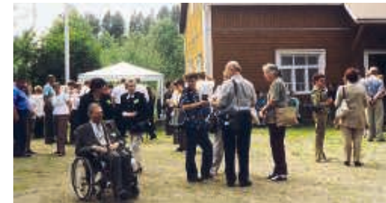
Lettuja odotellessaan Pielaveden sukuhaaran n. 130 hengen kokousväki jaloittelee Laukkalan nuorisoseurantaloon pihalla v. 2004.