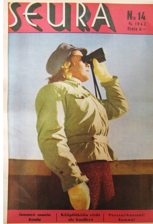
Julkaisulupa saatu Seura -lehdeltä.

http://www.sal.tkk.fi/vanhat_sivut/Opinnot/Mat2.198/esssee2001/tommigustafsson.pdf http://www.yhteishyva.fi/yhteishyva-lehti/toisin-ajateltu/0218010-120910