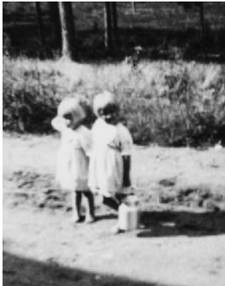
Kesäisellä maidonhakureissulla pikkusisaren kanssa.

Niukkuus loi muutakin kekseliäisyyttä, lehtien ilmoitussivut täytyivät osto-, myynti- ja vaihtotarjouksista. Joku antaisi hyvän turkinsa, jos saisi vastineeksi voita tai sianlihaa. Kaupunkikotien piholla ja jopa kylpyhuoneissa ja kellareissa rötkki sikoja. piparit leivottiin ruisjauhoista kun vehnää ei ollut, lihaksi kelpasivat variksetkin. Luonnonantimia käytettiin runsaasti, oli voikukka- ja vadelmanlehtiteetä, syötiin männyn- ja kuusenkerkkiä, ketunleipää, suolaheinää, oravia ja muunneltua teetä eli varista parafiinissa. Kahvia jatkettiin mm sikurirouheella tai koivunkäävällä eli erilaisilla korvikkeilla. Kaupassa myytävässä kahvissa oli aitoa