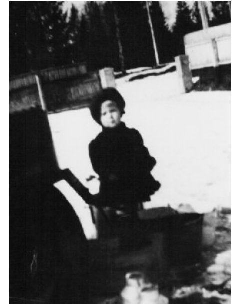
Lottien sopankeittoa katsomassa suojeluskuntatalon pihalla.