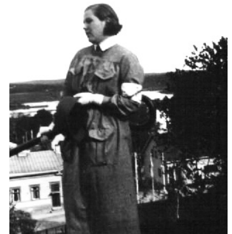
Äitini lottapuvussaan vuonna 1938.