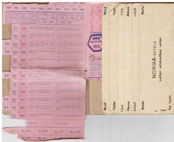
Isoäidin ostokortti ja Norma-korttikotelo.

Ostokortin kupongeilla sai tietyn määrän tarviketta kuukautta kohden. Tutkin isoitini