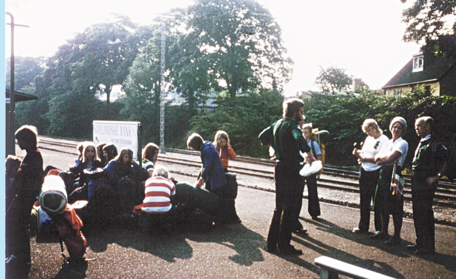
Tanskan leirin lähtöunnelmissa vuonna 1973. Minä olen kolmas oikealta.