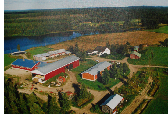
Halmelammin pihapiiri on 1700-luvulta lähtien ollut näissä maisemissa, vaikka rakennusten paikka ja lukumäärä ovatkin vaihdelleet. Tämä Halmelammin talon seinällä oleva ilmakuva on 2000-luvun alusta.