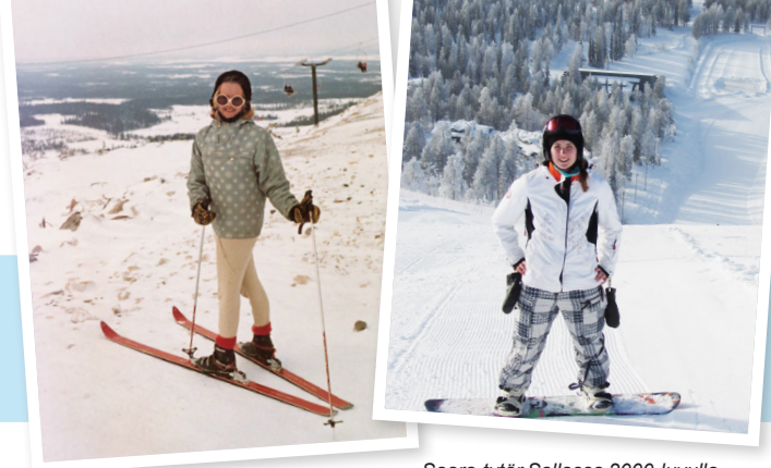
Pia-äiti Rukalla 1960-luvulla.