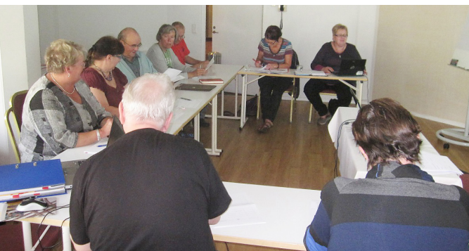
Sukuneuvoston kokous 14.09.2013