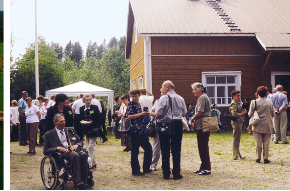
Pielaveden Laukkalan kylässä Laukkalantien varrella sijaitsevassa Laukkalan Nuorisoseuran talon toiminnassa myös kylän Laukkaset ovat olleet aktiivisesti mukana. Tämä kuva on vuonna 2004 pidetystä Pielaveden Laukkasten ensimmäisestä sukukokouksesta, jossa osallistujia oli n. 130.