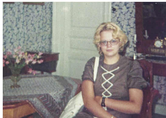
Minä Wehmaan kartanossa Juvalla vuonna 1972.

Oma nuoruuteni oli osallistumisen ja toiminnan aikaa. Aikaa oli jätettävä kotitöille ja kirjojen lukemiselle. Koulukin suoritettiin siinä sivussa. Opiskelut saatiin loppuun ajallaan. Elo oli muistini mukaan aika huoleton ja mukava. Työpaikan saanti oli lähes varmaa. Tulevaisuus näytti valoisalta.