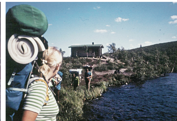
Kesävaeluksella Lapissa 1970-luvun alussa.

Nykyajan nuorilla, varsinkin tytöillä on suuri huoli ulkonäöstä merkivaatteiden saamisesta, opiskelupaikasta, töistä elämästä ja selviämisestä. Sosiaalinen media monine lajeineen ja ympäristön uhat vaativat nurkan takana. Toivottavasti nuorten