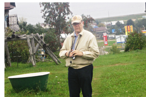
Vuorimarien pääkaupungin Kozmodemjanskin ulkomuseo.