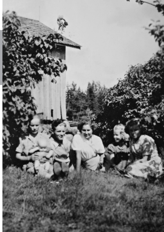
Valokuva mummolasta kesällä 1952.

Mummola oli rakas paikka. Siellä oli kaikkea sellaista, mistä pieni lapsi on kiinnostunut: lehmiä, lampaita, kanoja, sikoja, hevonen ja paljon vasikoita. Mummo lypsi lehmiä, osa maidosta kirnuttiin ja siitä saatiin tarpeet voita varten, kermaa herkullisiin leivonnaisiin ja piimää hellepäivien janojuomaksi. Maito meni pääosin meijeriin. Nykyajan hienoihin kylmiömenetelmiin verrattuna sen ajan maito varmaan