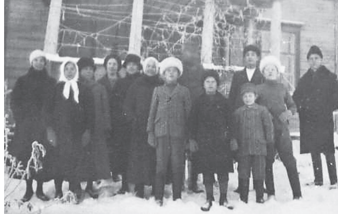
Kuva: Helmi Laukkanen Maamieskoulu