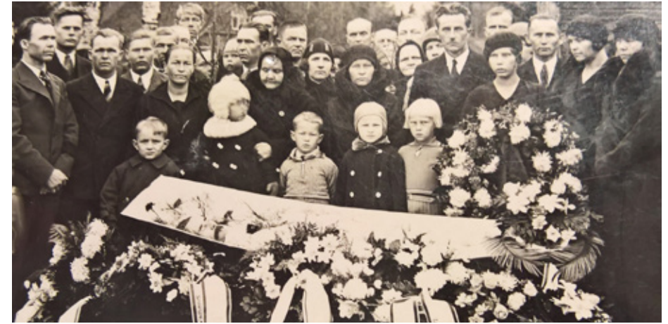
Kaatuneen sotilain hautajaiset.

Harlulaisten evakkojunat suuntasivat Kontiolahtelle, josta evakot siirtyivät Pohjois-Savon kautta Keski-Pohjanmaalle. Syksyn 1941 aikana valtaosa harlulaisista palasi evakkopaikkakunniltaan takaisin kotiseuduilleen. Lopul-