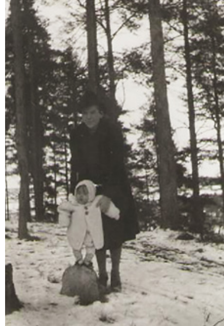
Seetrivaarassa 29.11.1939, sota alkoi 30.11.1939.

Kirjeidenvaihto jatkuu katkeamattomana. Ajoittain posti kulkee hitaasti. Joskus tulee monta kirjettä saman päivänä, joskus on monta päivää väliä. Katkokset saavat kotijoukot pelkäämään pahinta, rintamalla odotellaan kärsimättömästi onko kotona kaik-