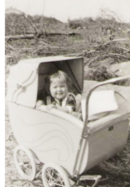
Sama paikka keväällä 1940.

ki kunnossa. Isä iloitsee saunareissuista ja nauttii niistä sydämensä pohjasta. Äiti kertoo miten lapsi edistyy, tytär oppii kävelemään.