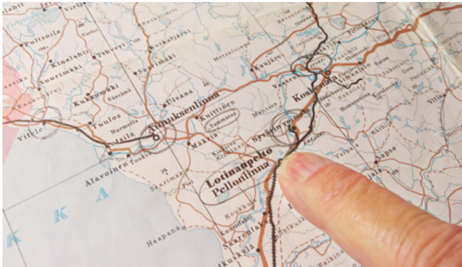
Evakkomatka oli pitkä.

Otto-isä palasi sodasta välirauhan aikana ja hän etsi heti töitä. Perhe päätyi Mätäsvaraaran Pielsjärvelle, jossa sijaitsi Outokummun kivi- ja puu- ja metalliteollisuus. Otto työskenteli siellä remonttimiehenä,